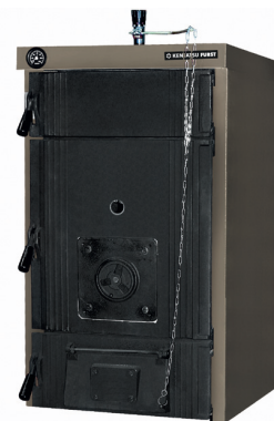
MAX 29–95 кВт